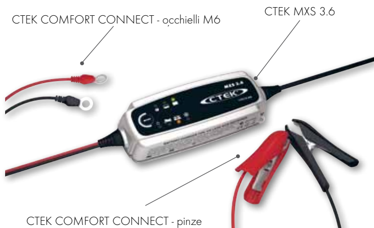
CTEK COMFORT CONNECT - occhielli M6